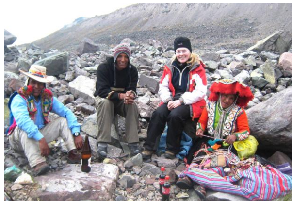
Zwischen Upis und Ausangate auf 5.200 m Höhe bei der Vorbereitung des Opferrituals

Eine gemeinsame Veranstaltung mit der Botschaft der Republik Peru, dem Lateinamerikaforum Berlin und der Arbeitsstelle „Diversität und Hybridität im Kontext von Kultur, Sprache und Kommunikation“, Technische Universität Berlin, Kommunikationswissenschaft