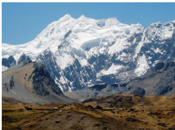
Der Gletscher des Ausangate, 6.384 m Höhe

Offen zu sein für Ungewöhnliches ist die Voraussetzung, um den Reichtum interkultureller Begegnungen zu erspüren und die Gedanken und Gefühle anderer Menschen wahrzunehmen. Der wichtigste Schlüssel für die Kommunikation mit ihrem tiefsten Inneren ist, ihre Sprache zu erlernen. Über die verschiedenen Dialekte der Quechua-Sprache, aber heute auch über das Spanische, vermitteln uns die Quechuas ihre Gedankenwelt und lassen uns teilhaben an ihrem Leben im rauhen Hochgebirge, in den milden Tälern und im grünen Dickicht des Urwaldes.