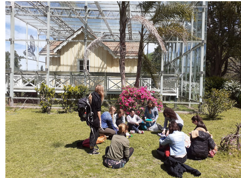
Exkursion der ISAP-Studierenden ins Tigre-Delta