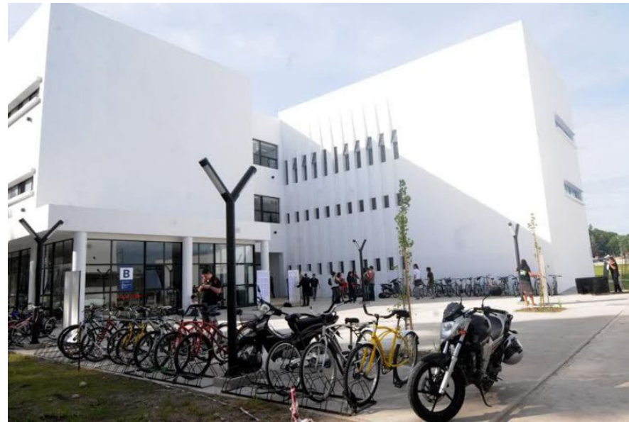
Campus der UNLP, Facultad de Humanidades